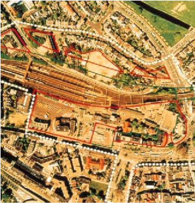
Figuur 1: locatie Arnhem-Centraal